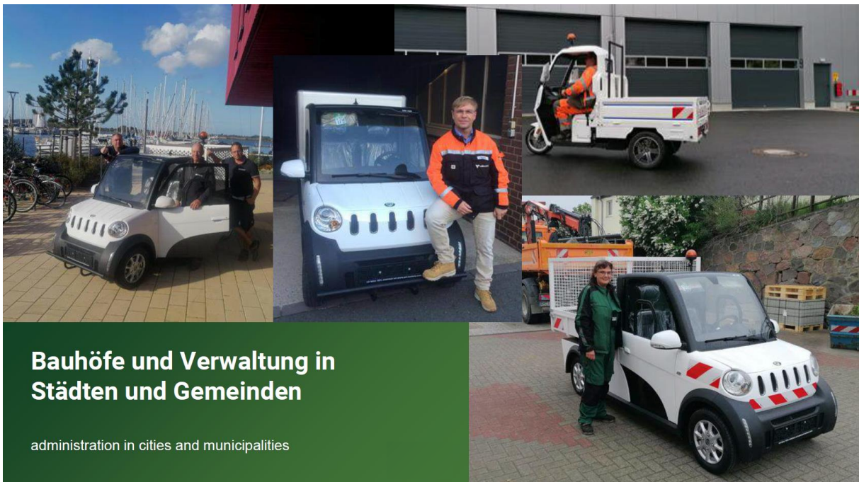
Bauhöfe und Verwaltung in Städten und Gemeinden

Schließlich bilden Bauhöfe und Verwaltungen in Städten und Gemeinden ein weiteres stark wachsendes Kundensegment von ARI Motors: