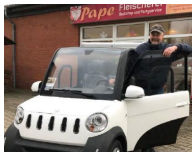
Kühlfahrzeug für Cateringservice in Mirow

cooling truck for catering company in Mirow