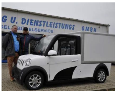
Kofferfahrzeug für Wäscheservice in Weißenfels