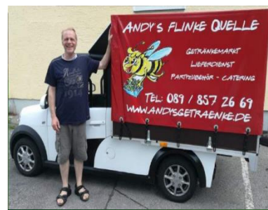
Planenfahrzeug für Lieferdienst in München

cooling truck for catering company in Mirow