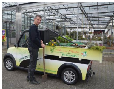
Kipperfahrzeug für Blumen Pfeiffer in Paderborn

Neben den Großunternehmen kommen die leistungsfähigen ARI-Nutzfahrzeuge bevorzugt auf der letzten Meile zum Einsatz. Kleinunternehmer wie Hausmeisterdienste, Handwerker, Gartenbaubetriebe, aber auch Dienstleister aller Art, vom Schornsteinfeger bis zum Pizza-Lieferdienst. Nachfolgend auch ein paar Beispiele von Kunden aus unserem Segment der Kleinunternehmer: